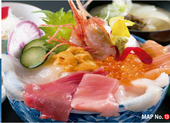
MAP No. 13