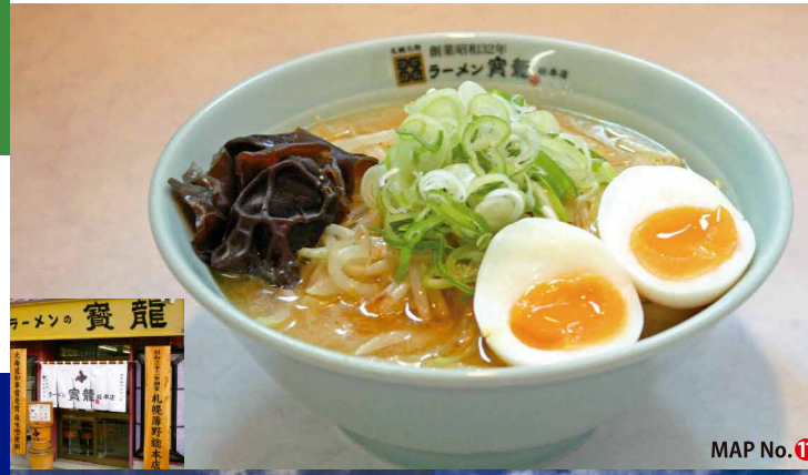
MAP No. 11