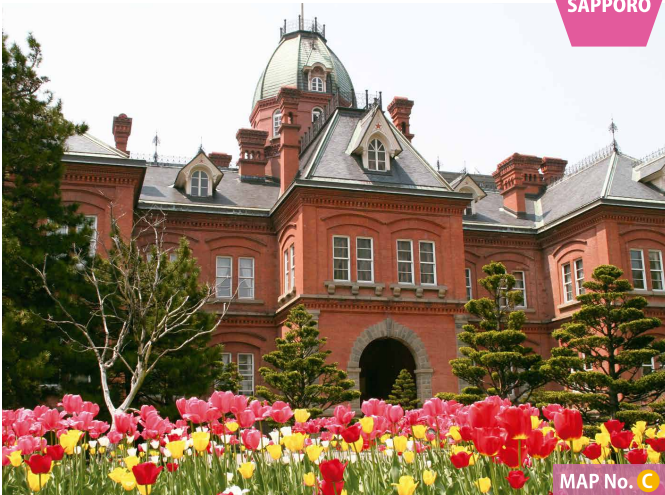
MAP No. C