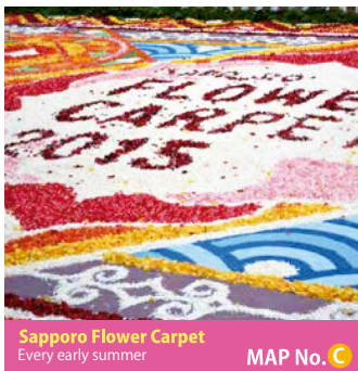
Sapporo Flower Carpet Every early summer